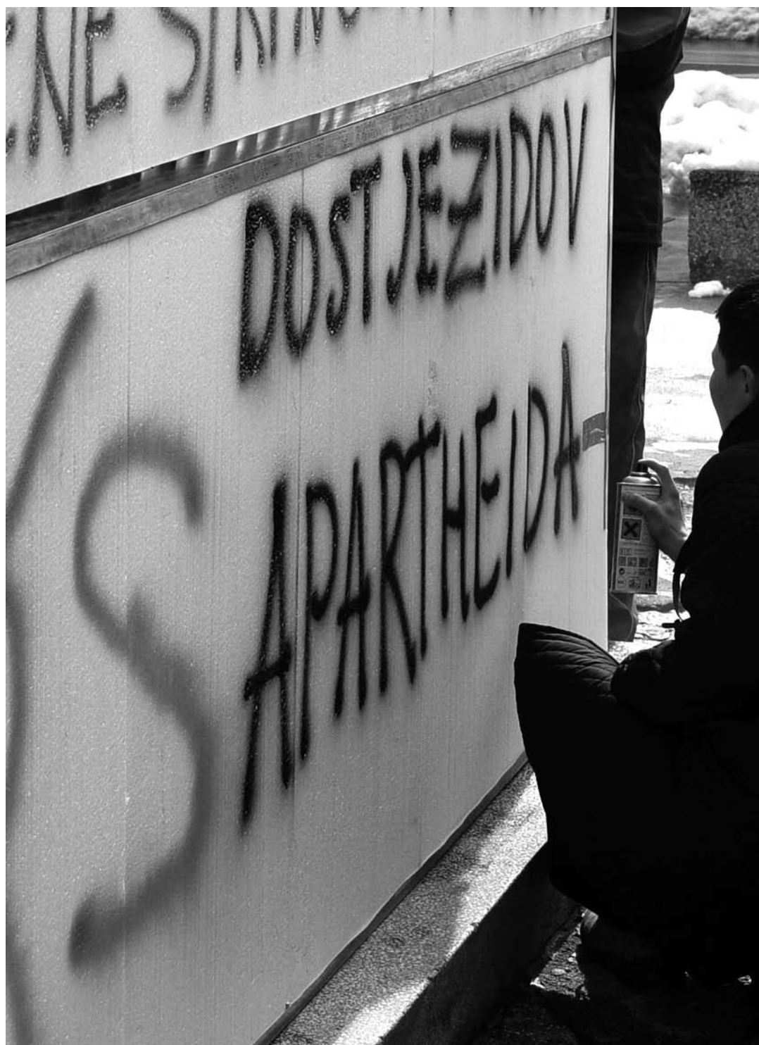
Pred sedežem Slovenske demokratske stranke v Ljubljani, 25. 2. 2004