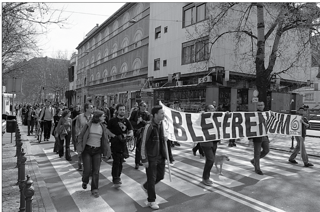
Protest proti referendumu o tehničnem zakonu v Ljubljani, 4. 4. 2004