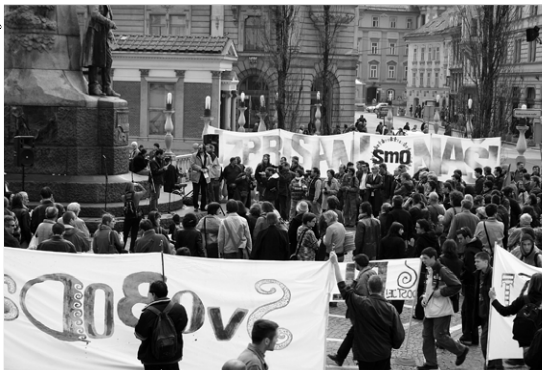
Zborovanje proti referendumu o tehničnem zakonu, 31. 3. 2004