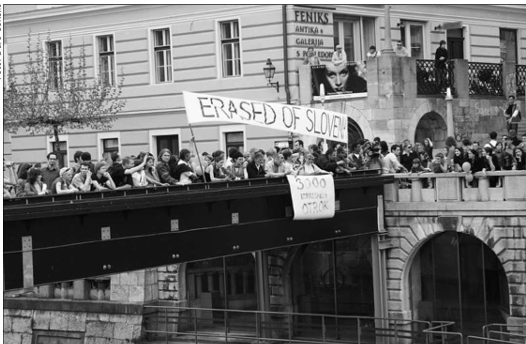
Protirasistične demonstracije v Ljubljani, 26. 6. 2006